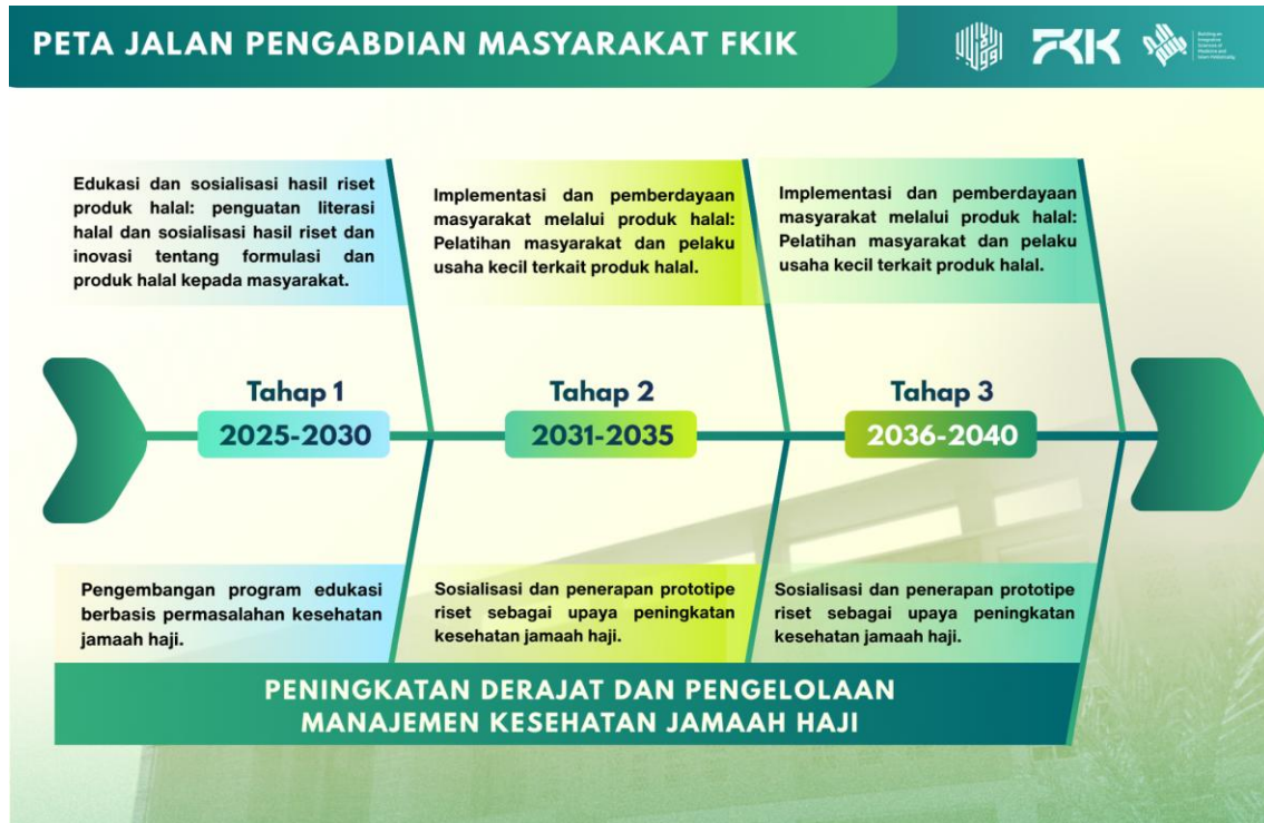
Gambar 2. 1 Road Map Pengabdian Masyarakat di FKIK UIN Maulana Malik Ibrahim Malang