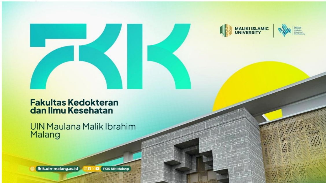
Gambar 4. Branding FKIK UIN Maulana Malik Ibrahim Malang