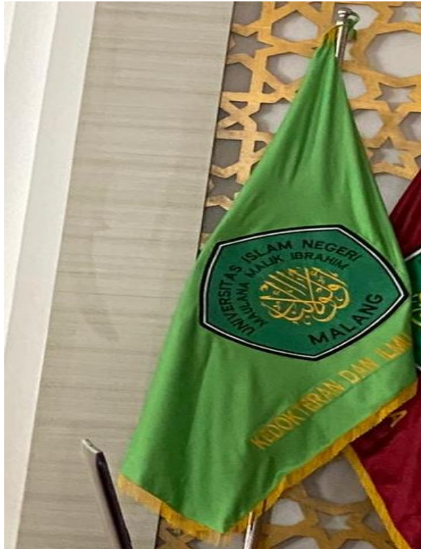
Gambar 6. Bendera FKIK UIN Maulana Malik Ibrahim Malang

(3) Bendera FKIK UIN Malang berwarna hijau dengan logo UIN