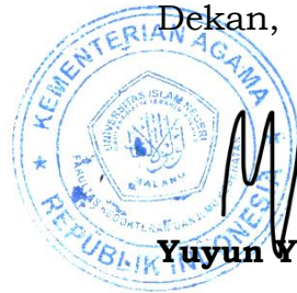
Yuyun Yueniwati PW